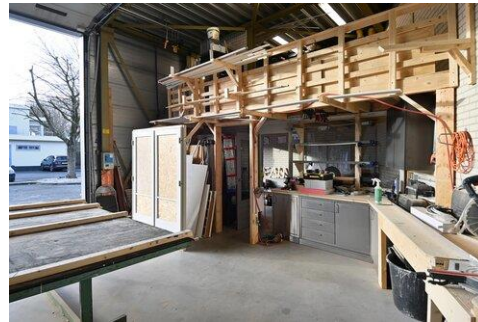
Oscar Romerolaan 16 - Hilversum