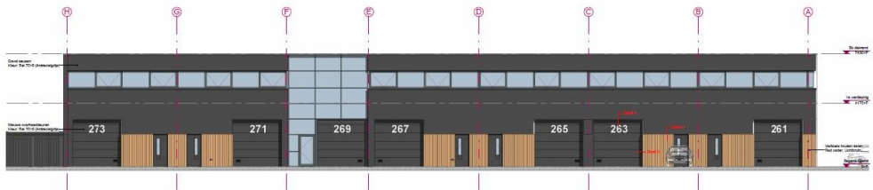
Noord-oostgevel schaal 1:100