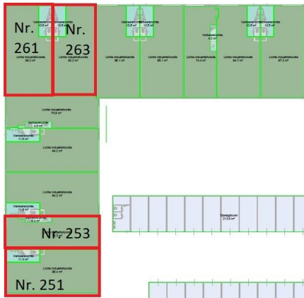
Begane Grond functies schaal 1:100