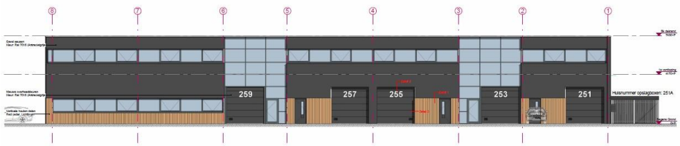
Noord-westgevel schaal 1:100