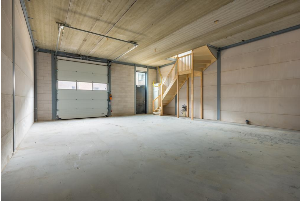
Deze en onderstaande foto zijn van een vergelijkbare ruimte aan de Nieuwe Havenweg. De beschikbare ruimte is voorzien van een ingangshal.