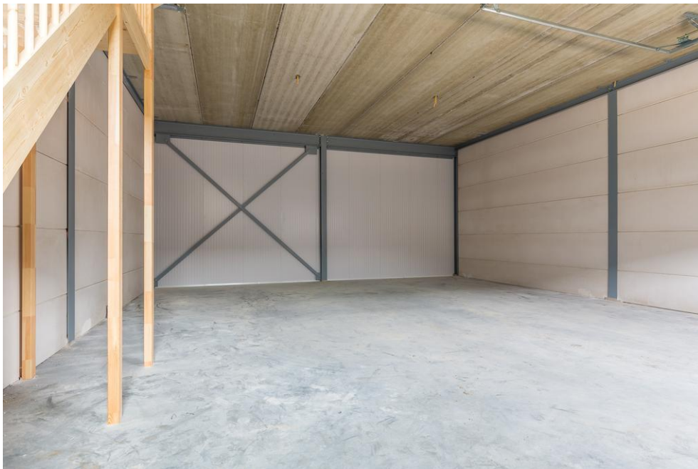
Deze foto is van een vergelijkbare ruimte aan de Nieuwe Havenweg.